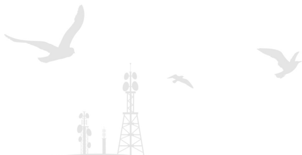
ANTONIO JUSTINO DE ARAUJO NETO

DOM nº 1689, ano 45, de 30 de outubro de 2023 - SUPLEMENTO